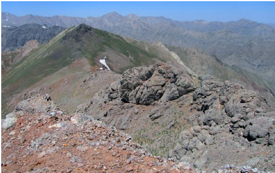
تصویر شماره ۶: نمایی از قله خرسنگ فرعی از روی قله خرسنگ جنوبی