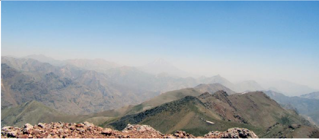
تصویر شماره ۸: قله دماوند از روی قله خرسنگ جنوبی