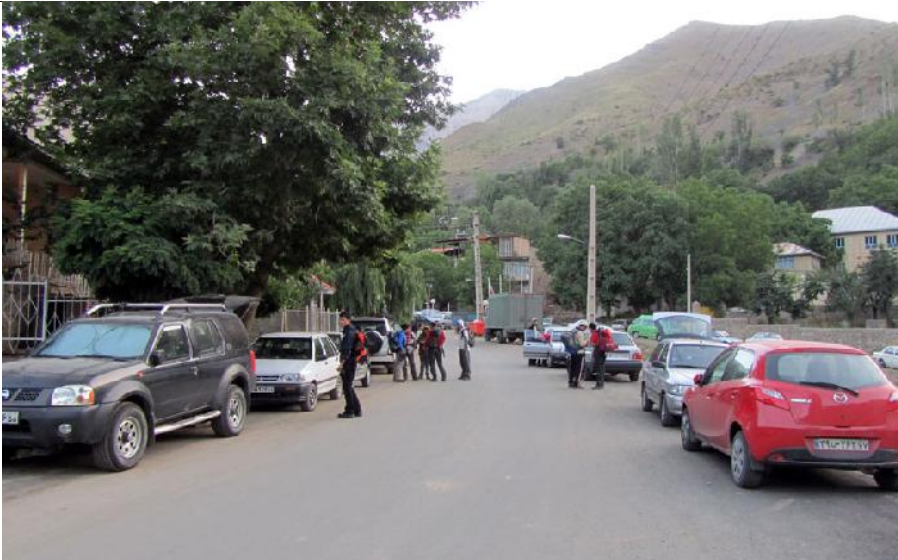
تصویر شماره ۳: روستای آبنیک، پارک ماشین‌ها و آغاز حرکت