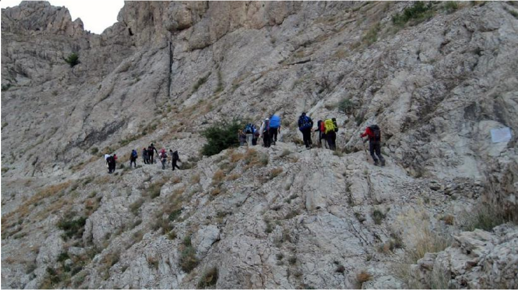
تصویر شماره ۵: حرکت به سوی دشت جانستون