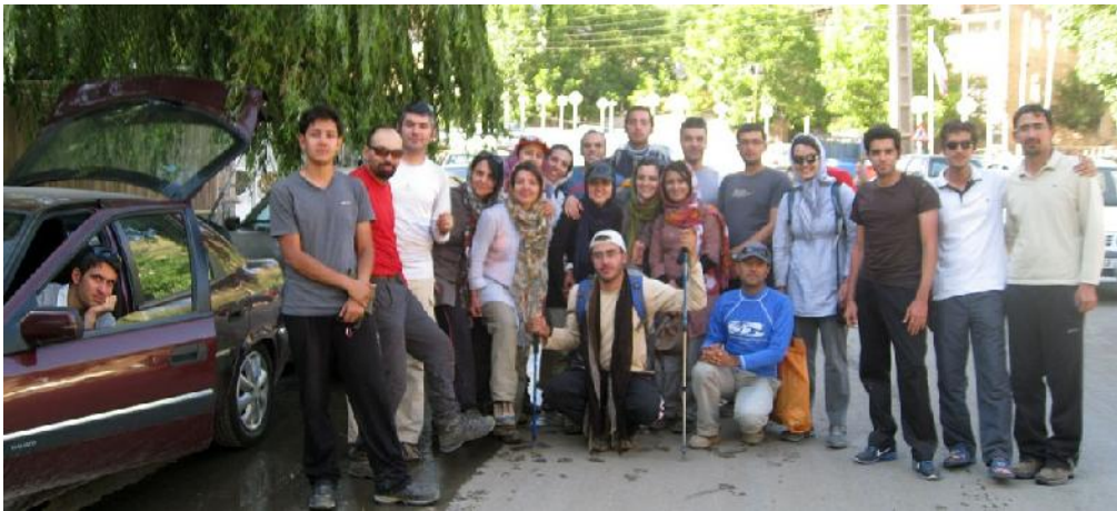
تصویر شماره ۷: عکس یادگاری هنگام بازگشت به تهران