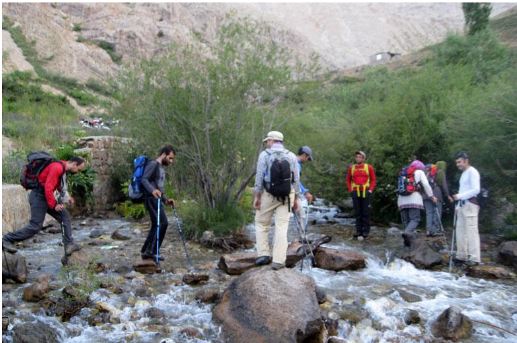
تصویر شماره ۴: عبور از رودخانه