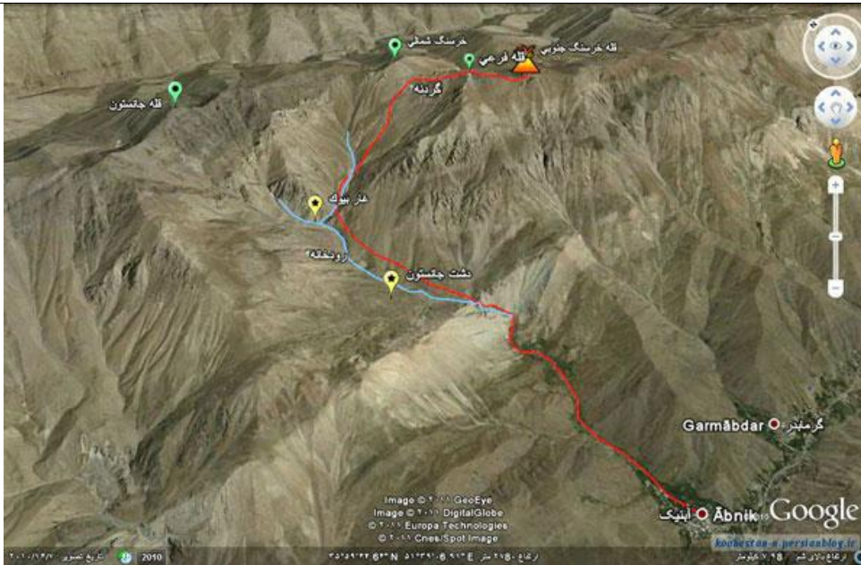
تصویر شماره ۱: موقعیت دشت جاستون و قله‌های خرسنگ